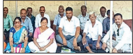
आरोप ग्रामस्थांनी केला आहे. अधिकाऱ्यांनी सर्व्हे करूनही आणि जमीन मालकाने जागा उपलब्ध करून देऊनही ट्रान्सफॉर्मर बसवला गेला नाही.