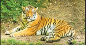
विश्वास राणी बाग प्राणीसंग्रहालयातील अधिकाऱ्याने व्यक्त केला. सध्या 'करिष्मा' आणि 'जय' हे नर-मादी वाघ राणी बागेत आहेत. हे दोन्ही रॉयल बंगाल वाघ आहेत. या वाघांनाही पाहण्यासाठी पर्यटक गर्दी करत असतात. आता त्यांच्या जोडीला ही आणखी नर-मादी वाघाची जोडी आणण्यासाठी राणी बाग प्राणीसंग्रहालय प्रयत्न करत आहे. त्याबद्दल्यात पक्षी किंवा प्राणी पत्रव्यवहार केला असून लवकरच त्यासाठी परवानगी मिळेल, असा