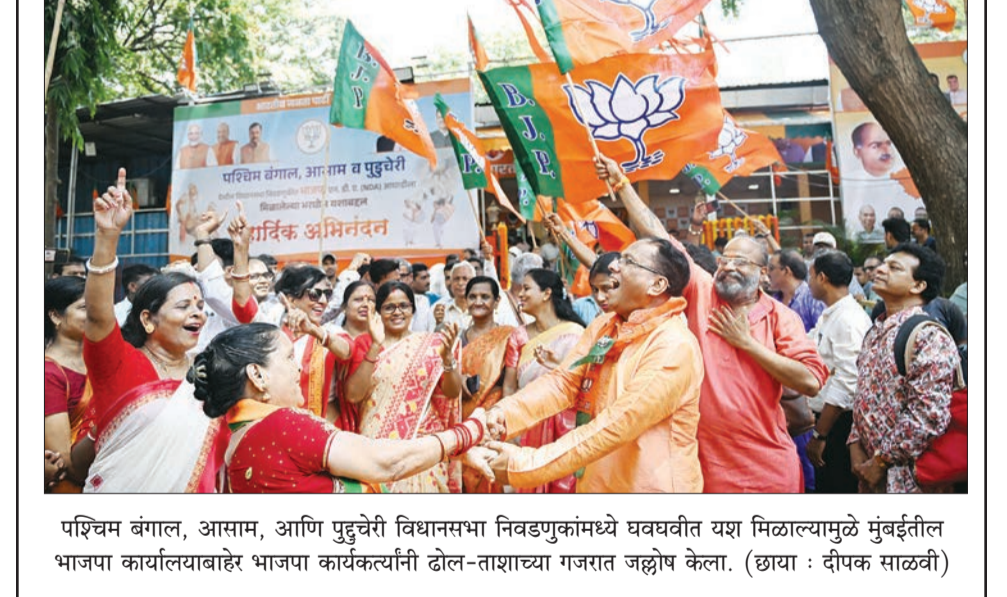
पश्चिम बंगाल, आसाम, आणि पुद्दुचेरी विधानसभा निवडणुकांमध्ये घवघवीत यश मिळाल्यामुळे मुंबईतील भाजपा कार्यवायाबाहेर भाजपा कार्यकर्त्यांनी ढोल-ताशाच्या गजरात जल्लोष केला.