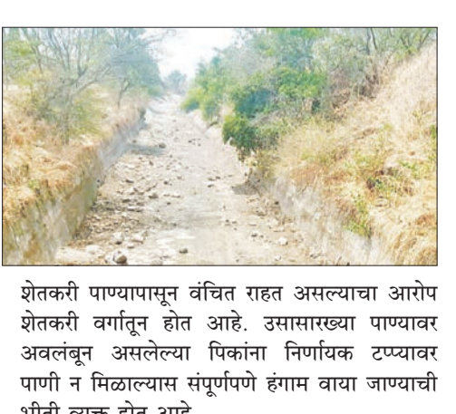
शेतकरी पाण्यापासून वंचित राहत असल्याचा आरोप शेतकरी वर्गातून होत आहे. उसासारख्या पाण्यावर अवलंबून असलेल्या पिकांना निर्णायक टप्प्यावर पाणी न मिळाल्यास संपूर्णपणे हंगाम वाया जाण्याची भीती व्यक्त होत आहे.

कराड - तालुक्यातील आरफळ कालवा कोरडा पडल्याने मसूर भागातील शेतकऱ्यांच्या उसासह अनेक पिके करपण्याच्या मार्गावर आहेत. नियोजित रोटेशन कोलमडल्याने शेतीबरोबरच पिण्याच्या पाण्याचाही प्रश्न गंभीर बनला आहे. अनेक दिवसांपासून कालव्यात पाण्याचा थेंब नसल्याने कालवा पूर्णपणे कोरडा पडला आहे. त्यावर अवलंबून असलेल्या विहिरींचे जलस्तरही झपाट्याने घसरले आहेत. अनेक विहिरी कोरड्या पडल्याने गावागावांत पिण्याच्या पाण्याची टंचाई जाणवू लागली आहे. वरच्या टोकावर अनियमित व अनधिकृत पाणीउचल होत असल्याने शेवटच्या टोकावरील