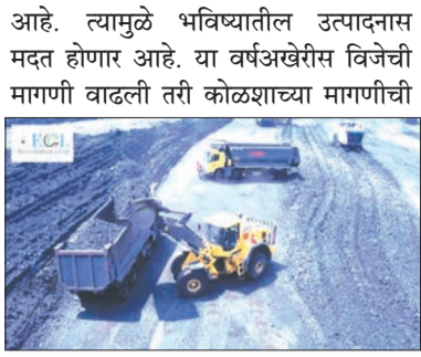
चिंता करण्याची गरज भासणार नाही. कंपनीने आर्थिक वर्ष २०२३-२४ मध्ये आतापर्यंतचा सर्वांत वेगवान १०० दशलक्ष

साऊथ ईस्टर्न कोलफिल्ड्स लिमिटेड कंपनीने ओक्टोबरमध्ये एप्रिल महिन्यात ४.४९ टक्क्यांची वाढ झाली