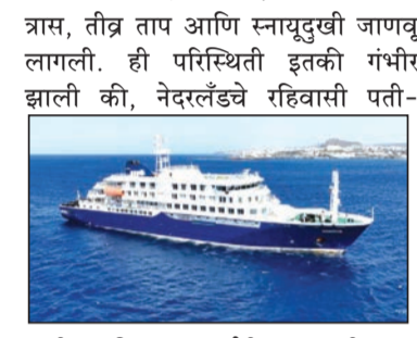
पत्नी आणि एक जर्मनीच्या नागरिकाचा मृत्यू झाला. सध्या हे जहाज केप वर्दे या बेटाजवळ आणले आणि अधिकाऱ्यांनी

अटलांटिक महासागरातील एमव्ही हॉंडियस या लहान क्रूझ जहाजावर हॅटाव्हायरसचा संशयित प्रादुर्भाव झाल्यामुळे ३ जणांचा मृत्यू झाला, तर एक ब्रिटिश नागरिक गंभीर अवस्थेत आहे हे जहाज सध्या केप वर्देच्या किनाऱ्याजवळ असून त्यावर १४९ प्रवासी आहेत.