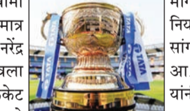
आयपीएल २०२६ चा अंतिम सामना बंगळूरुहून अहमदाबादला हलवण्यात आला आहे.