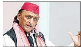
अखिलेश यादव यांच्या पश्चिम बंगालमध्ये ममता बॅनर्जी यांचा तृणमूल काँग्रेस व तामिळनाडूत एम. के. स्टॅलिन यांचा द्रमुकसाठी निवडणूक रणनीति व प्रचार व्यवस्थापनात आय-पॅकची भूमिका होती. अखिलेश यादव यांच्या

नेतृत्वाखालील समाजवादी पक्षाने आय-पॅकची नियुक्ती केल्याची औपचारिक घोषणा केली नव्हती. मात्र, निवडणूक प्रचार व्यवस्थापनासाठी संभाव्य सहकार्याबाबत अनेक महिन्यांपासून चर्चा सुरू होती. आता त्या चर्चा थांबवण्यात आल्याचे सांगितले जात आहे. समाजवादी पक्ष आता बाह्य सल्लागार संस्थांवर अवलंबून राहण्याऐवजी स्वतःच्या संघटनात्मक ताकदीवर व अंतर्गत राजकीय यंत्रणेवर भर देऊ इच्छित आहे.