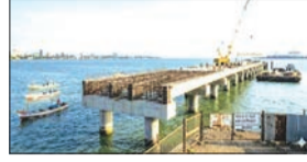
कारण्याचे उद्दिष्ट होते, पण हा मुहूर्तही आता टळला आहे. सध्या एकूण कामापैकी केवळ ३८ ते ५० टक्के काम पूर्ण झाल्याचा अंदाज आहे. तांत्रिक अडचणी आणि कामातील

काम कासव गतीने सुरू आहे. वारंवार मुदतवाढ मिळाल्यानंतर, आता ही सेवा एप्रिलपर्यंत सुरू विलंबामुळे या प्रकल्पाचा खर्च ५० कोटीवरून ७५ कोटी रुपयांवर पोहोचला आहे. जेटीचे अपूर्ण बांधकाम आणि जेटीपर्यंत जाणाऱ्या रस्त्यांचे काम अजूनही पूर्ण झालेले नाही. ही सेवा सुरू झाल्यास उरण आणि रायगड भागातील प्रवाशांना आपली चारचाकी, दुचाकी वाहने बोटीने थेट मुंबईला भाऊचा धक्का येथे नेता येतील. त्यामुळे प्रवासाचा वेळ आणि अंतर लक्षणीयरीत्या कमी होईल.