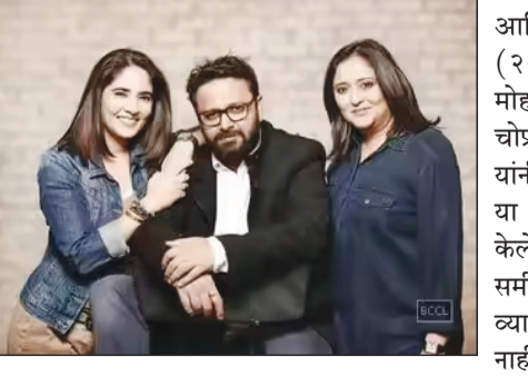
प्रोडक्शन हाऊसशीही ते जोडले गेले आहेत. अडवाणींनी सईद आणि अझीझ मिर्झा यांना सहाय्य करत, नया नुकड (१९९४) च्या दिग्दर्शनातून कारकिर्दीची सुरुवात केली आणि इस रात की सुबह

आणि कभी खुशी कभी गेम (२००१) मध्ये असिस्ट केले. मोहब्बतें (२०००) मध्ये आदित्य चोप्रा यांना असिस्ट केले. निखिल यांनी कल हो ना हो (२००३) या चित्रपटाद्वारे दिग्दर्शनात पदार्पण केले. चित्रपटाला सकारात्मक समीक्षक प्रतिसाद मिळाला आणि तो व्यावसायिक यशस्वी ठरला. इतकंच नाही तर या वर्षातील सर्वाधिक कमाई करणारा भारतीय चित्रपटही ठरला. २००४ मध्ये दोन राष्ट्रीय चित्रपट पुरस्कार, आठ फिल्मफेअर पुरस्कार, १३ आंतरराष्ट्रीय भारतीय चित्रपट अकादमी पुरस्कार, सहा निमते गिल्ड चित्रपट