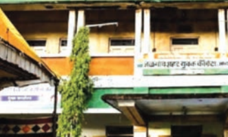
काँग्रेस भवन केवळ नेत्यांच्या महत्त्वाच्या बैठका आणि ऐतिहासिक निर्णय घेण्यात आले आहेत. इमारतीला ७५ वर्षे पूर्ण झाली असून सध्या वास्तूचा काही भाग कोसळल्यामुळे सुक्ष्मका प्रश्न निर्माण झाला आहे. यामुळेच नूतनीकरणाला निर्णय घेण्यात आला आहे.

एक इमारत नसून जळगाव जिल्हाच्या राजकीय स्थित्यंतराचे केंद्र राहिले आहे. माजी पंतप्रधान इंदिरा गांधी