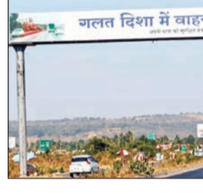
दशा में वाहन ना चलाएं' आणि 'लेन में वाहन चलाएं' अशा हिंदीतील सूचना देण्यात आल्या आहेत. महाराष्ट्रात स्थानिक भाषा मराठी असताना हिंदीचा वापर केल्यामुळे हा मराठीचा अपमान