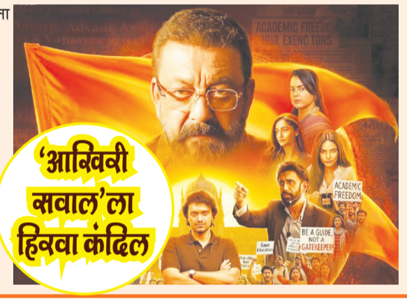
'आर्विवी सवाल'ला हिरवा कंदील

मुंबई, पुणे, मराठवाडा आणि अहिल्यानगरला अधिक वेगवान, सक्षम आणि आधुनिक जोडणी देणाऱ्या महत्त्वाकांक्षी नेरळ-वांद्रे-पाईट-शिरुरी-पावळ-मळठण-शिरूर या १३४ किमी. लांबीच्या चौपदरी महामार्ग प्रकल्पाला राज्य शासनाची मान्यता मिळाली. या प्रकल्पासाठी दिवंगत उपमुख्यमंत्री अजित पवार यांनी सातत्यपूर्ण प्रयत्न केले होते. राज्याच्या सर्वांगीण विकासासाठी त्यांनी पाहिलेले स्वप्न पुढे नेत हा प्रकल्प प्रत्यक्षात साकार करणे, हीच त्यांना खरी आदर्शपत्नी असल्याचे उपमुख्यमंत्री सुनेत्रा पवार यांनी एक्स पोस्ट करत म्हटले.