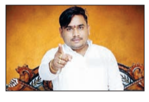
या प्रकरणातील फिर्यादी पंढरपूर तालुक्यातील व्यावसायिक असून, व्यवसायात मोठा फायदा करून देण्याचे आम्पिष दाखवत वीरकरने त्यांच्याकडून लाखो

सोलापूर (ओबीसी) समाजासाठी स्वतंत्र रकाना नसल्याच्या निषेधार्थ भंडारा जिल्ह्यात ओबीसी बांधव आक्रमक झाले आहेत. सकल ओबीसी समाज आणि ओबीसी संघर्ष समितीने केंद्र सरकारविरोधात जोरदार एल्यार पुकारला असून, जनगणनेवर बहिष्कार टाकण्याचा निर्णय जाहीर केला आहे. जनगणनेच्या पहिल्या टप्प्यातील प्रश्न क्रमांक १२ मध्ये अनुसूचित जाती (एससी), अनुसूचित जमाती (एसटी) आणि सामान्य प्रवर्गाचा उल्लेख आहे. मात्र इतर मागासवर्गीय