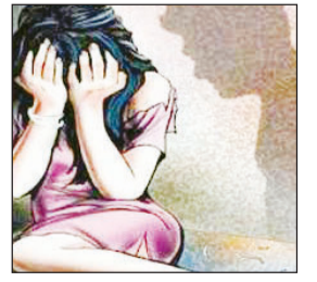
आणि मुंबईसारख्या प्रगत शहरांमधील महिला सुरक्षेचा प्रश्न पुन्हा एकदा ऐंणीवर आला आहे. या अहवालानुसार, देशातील १९ महानगरांमध्ये

नॅशनल क्राइम रेकॉर्ड्स युरो- २०२४ च्या अहवालानुसार, महिला आणि मुलांविषयक लैंगिक अत्याचारांच्या गुन्ह्यांच्या आकडेवारीत मुंबई तिसऱ्या तर पुणे पाचव्या क्रमांकावर आहे. मुंबईत ४११, हैदराबादमध्ये ३५८ तर पुण्यात २४४ गुन्ह्यांची नोंद करण्यात आली आहे. देशातील १९ महानगरांमध्ये महिला अत्याचारांच्या एकूण ५० हजार ५८४ घटना नोंदवण्यात आल्या आहेत. या आकडेवारीमुळे पुणे