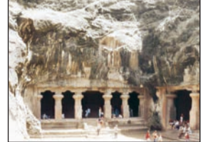
घारापुरी बेटावरील शेतबंदर, राजबंदर आणि मोराबंदर येथील रहिवासी पर्यटन आणि त्याच्याशी संबंधित छोट्या छोट्या व्यवसायांवर मोठ्या प्रमाणात अवलंबून आहेत.

समितीला एक लेखी निवेदन दिले. या बेटावर राहणारे रहिवासी उपजिविकेसाठी मुख्यत्वे पर्यटनावर अवलंबून आहेत. मात्र एएसआयच्या निर्बंधांमुळे येथे विकासाची कोणतेही कामे गेल्या वर्षात झालेली नाही. त्यामुळे पर्यटनाला चालना मिळत नाही, असे निवेदनात म्हटले आहे. घारापुरी बेटावरील शेतबंदर, राजबंदर आणि मोराबंदर येथील रहिवासी पर्यटन आणि त्याच्याशी संबंधित छोट्या छोट्या व्यवसायांवर मोठ्या प्रमाणात अवलंबून आहेत.