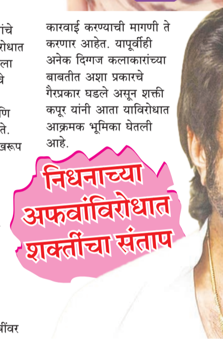
निधनाच्या अफवांविरुद्ध शक्तीचा संताप

ज्येष्ठ अभिनेते शक्ती कपूर यांनी त्यांच्या निधनाबाबत समाजमाध्यमांवर पसरणाऱ्या अफवांचे खडण केले असून अशा अफवा पसरवणाऱ्यांविरुद्ध सायबर पोलिसांकडे तक्रार करण्याचा निर्णय घेतला आहे. गेल्या काही दिवसांपासून शक्ती कपूर यांचे निधन झाल्याच्या खोटेच्या बातम्या इंटरनेटवर फिरत होत्या, ज्यामुळे त्यांच्या चाहत्यांमध्ये आणि चित्रपटसृष्टीत चिंतेचे वातावरण निर्माण झाले होते. यावर स्पष्टीकरण देताना त्यांनी स्वतः आपण सुखरूप असल्याचे सांगितले आणि या अफवांना 'फेक' असल्याचे स्पष्ट केले.