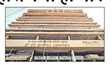
सात मजली संत ज्ञानेश्वर दर्शन मंडप आता इतिहासजमा होणार आहे. मंदिर परिसरात प्रस्तावित कॉरिडोर प्रकल्प आणि रस्ता रुंदीकरणसाठी प्रथम टप्प्यात मंदिराच्या मालकीच्या इमारती हटवण्याचा निर्णय घेण्यात आला आहे.

पंढरपूर विठ्ठल मंदिराशेजारी गेली तब्बल ३७-३८ वर्षे हजारो भाविकांना सामावून घेणारा ऐतिहासिक सात मजली संत ज्ञानेश्वर दर्शन मंडप आता इतिहासजमा होणार आहे. मंदिर परिसरात प्रस्तावित कॉरिडोर प्रकल्प आणि रस्ता रुंदीकरणसाठी प्रथम टप्प्यात मंदिराच्या मालकीच्या इमारती हटवण्याचा निर्णय घेण्यात आला आहे. नामदेव पायरीलगत असलेल्या या दर्शन मंडपात विठ्ठल दर्शनासाठी येणाऱ्या भाविकांच्या लांबच लांब