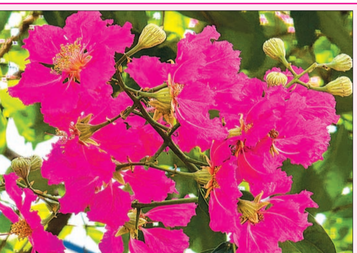
पावसाळा जवळ आला की निसर्ग फुलांनी सजून जातो. मुंबईत विविध प्रकारच्या फुलांचा बहर आला आहे.

नवी मुंबईला पाणीपुरवठा करणाऱ्या मोरबे धरणात सध्या केवळ ८५ दिवस पुरेल इतकाच म्हणजे सुमारे ४३ टक्क्यापेक्षा पेक्षा कमी पाणीसाठा शिल्लक आहे. त्यातच एल निनोमुळे पावसाळ्याच्या विलंबाच्या आणि कमी पावसाच्या शक्यतेमुळे, नवी मुंबई महापालिका प्रशासनाने नागरिकांना पाणी जपून वापरण्याचे आवाहन केले आहे. मोरबे धरणात ४३ टक्केपेक्षा कमी पाणीसाठा असून १०३ दिवस पुरेल इतका साठा उपलब्ध असल्याची माहिती देण्यात आली होती, मात्र अद्ययावत