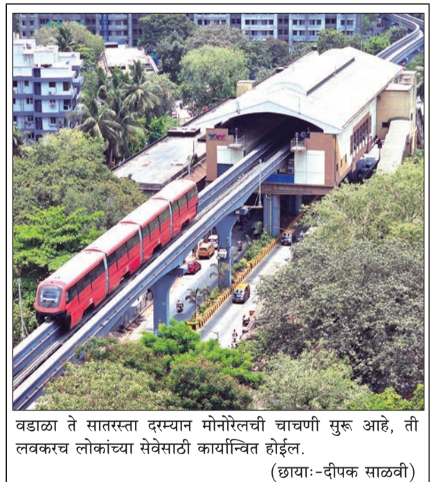
वडाळा ते सातस्ता दरम्यान मोनोरेलची चाचणी सुरू आहे, ती लवकरच लोकांच्या सेवेसाठी कार्यान्वित होईल.

साताऱा जागतिक स्तरावर सुरू असलेले तणाव, डळमळीत अर्थव्यवस्था आणि परकीय चलन बचतीची गरज लक्षात घेता पंतप्रधान नरेंद्र मोदी यांनी देशवासीयांना काटकसरीचे आवाहन केले आहे. साताऱ्यात होणाऱ्या प्रधानमंत्री आवास योजनेतील ५ लाख घरांच्या लोकार्पण सोहळ्यावर होणाऱ्या कथित कोट्यवधींच्या खर्चांमुळे भाजपाच आपल्या नेत्याच्या आवाहनाला हरताळ फासत असल्याची चर्चा रंगली आहे.