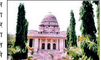
सध्याच्या बदलत्या हवामानामुळे परिस्थितीत आणखी बिकट झाली आहे. त्यामुळे १५ जूनपासून शाळा सुरू करणे विद्यार्थ्यांच्या आरोग्यास धोकादायक ठरू शकते. यापूर्वी ८ जून २००७ रोजी उच्च न्यायालयाने याच मुद्यावर निर्णय देताना विदर्भातील शाळा २६ जूननंतर सुरू करण्याचे निर्देश दिले होते. त्यानंतर राज्य सरकारने १६ जून २००७ रोजी शासन निर्णय काढून या सूचनांचे पालन केले होते. हा निर्णय २०२३ पर्यंत कायम होता. मात्र, २०२३ मध्ये शाळा ३० जूनपासून सुरू करण्याचा निर्णय घेण्यात आला.