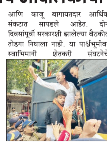
आणि काजू बागायतदार आर्थिक संकटात सापडले आहेत. दोन दिवसांपूर्वी सरकारशी झालेल्या बैठकीत तोडगा निघाला नाही. या पार्श्वभूमीवर स्वाभिमानी शेतकरी संघटनेचे

बदलत्या हवामानाचा फटका बसल्याने यावर्षी कोकणातील आंबा