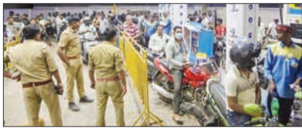
परिस्थिती अधिकच गंभीर बनली आहे. जिल्हातील १६५ पैकी निम्म्याहून अधिक पेट्रोल पंप मागील तीन दिवसांपासून

बंद आहेत. सिंदखेड राजा तालुक्यात इंधन भरण्यावरून एका व्यक्तीला मारहाण झाल्याची घटना काल घडली. वाशिममध्येही डिझेलसाठी