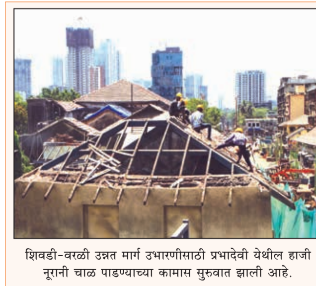
शिवडी-वरळी उन्नत मार्ग उभारणीसाठी प्रभादेवी येथील हाजी नूरानी चाळ पाडण्याच्या कामास सुरुवात झाली आहे.