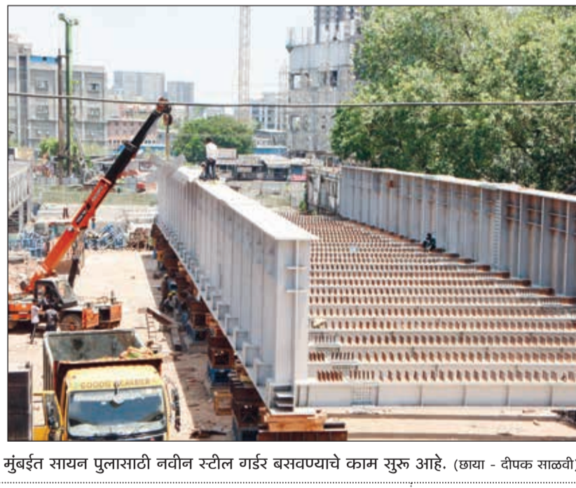
मुंबईत सायन पुलासाठी नवीन स्टील गर्डर बसवण्याचे काम सुरू आहे.