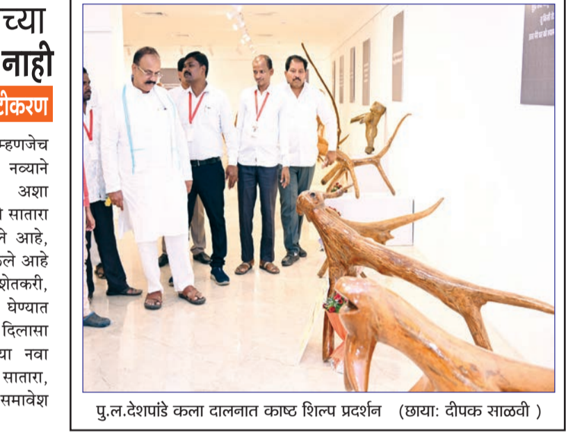
पु.ल.देशपांडे कला दालनात काष्ठ शिल्प प्रदर्शन

सहाद्री व्याघ्र प्रकल्पाच्या कारिडारचा म्हणजेच भ्रमण मार्गाचा विस्तार सध्या होणार नाही. नव्याने तयार करण्यात आलेल्या आखाड्यात अशा कोणत्याही प्रस्तावाचा समावेश नसून यामध्ये सातारा आणि सांगली जिल्ह्यातील गावांना वगळले आहे, असे सहाद्री व्याघ्र प्रकल्प विभागाने स्पष्ट केले आहे. जनसुनावणी व स्थानिक शेतकरी, लोकप्रतिनिधींच्या विरोधानंतर हा निर्णय घेण्यात आला असून यामुळे बाधितांना मोठा दिलासा मिळाला आहे. सहाद्री व्याघ्र प्रकल्पाच्या नवा भ्रमण मार्ग म्हणजे कारिडार आखाड्यात सातारा, सांगली जिल्ह्यातील कोणत्याही गावांचा समावेश केला नसल्याचे प्रशासनाने स्पष्ट केले आहे.