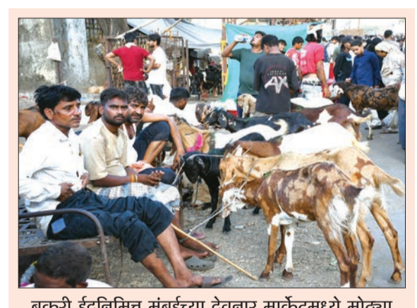
बकरी ईदनिमित्त मुंबईच्या देवनार मार्केटमध्ये मोठ्या संख्येने बकरे विक्रीसाठी आणले होते.

बजावणारी बेली केवळ श्वान नव्हती, तर पोलिस दलातील प्रत्येकासाठी ती कुटुंबातील सदस्यासारखी होती. पडद्या,शाहापूर, मुंबबाड परिसरात अनेक बंद घरांमध्ये झालेल्या घरफोड्यांचा तपास लावण्यात बेलीची मदत घेतली होती. महामार्गाच्या कडेला किंवा जंगलाने वेढलेल्या ग्रामीण भागात होणाऱ्या दरोड्यांच्या घटनांमध्ये आरोपी पळून जाण्यात यशस्वी व्हायचे.