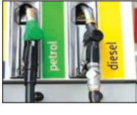
उत्तर प्रदेशच्या नेपाळ सीमेलगत असलेल्या जिल्ह्यांमध्ये काही लोक पेट्रोल-डिझेलची नेपाळमध्ये विक्री करत असल्याचा आरोप स्थानिकांकडून केला जात आहे.

लखनऊ | उत्तर प्रदेशच्या नेपाळ सीमेलगत असलेल्या जिल्ह्यांमध्ये काही लोक पेट्रोल-डिझेलची नेपाळमध्ये विक्री करत असल्याचा आरोप स्थानिकांकडून केला जात आहे. या तस्करीमुळे या जिल्ह्यांमध्ये इंधनाची तीव्र टंचाई जाणवू लागली आहे. उत्तर प्रदेशमध्ये पेट्रोल प्रति लीटर १०० रुपये दराने विकले जाते. मात्र तेच पेट्रोल नेपाळमध्ये प्रति लीटर १३५ रुपये एवढ्या चढ्या दराने विकले जात असल्यामुळे तस्करीला उत आला आहे. उत्तर प्रदेशच्या महाराजगंज, सिध्दार्थनगर, बलरामपूर, श्रावस्ती, बहराईच, लखिमपूर खेरी आणि फिलिभित या जिल्ह्यांमध्ये इंधनाचा मोठ्या प्रमाणात टुटवडा जाणवत आहे. यासंदर्भात सरकारी अधिकाऱ्यांनी सांगितले की, मध्य पूर्वेतील युद्धामुळे जगभरात इंधन तेलाचा टुटवडा भासत आहे. भारत सरकारने अशा कठीण परिस्थितीत भारत सरकारने पेट्रोल-डिझेलची दरवाढ प्रति लीटर ७ ते ७.५० रुपयांपर्यंत मर्यादित ठेवली आहे. मात्र नेपाळमध्ये परिस्थिती बिकट आहे. अनेक पेट्रोल पंप बंद पडले आहेत.