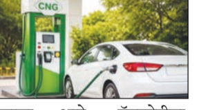
झाला आहे. गॅसखेदीचा खर्च वाढल्यामुळे दरवाढ करावी लागल्याचे स्पष्टीकरण कंपनीकडून देण्यात आले आहे. नाशिकमध्ये सीएनजीच्या दरत प्रति किलो १ रुपया ३५ पैशांची वाढ झाली आहे. त्यामुळे शहरातील सीएनजीचा नवा दर ९६ रुपये ५० पैसे

पेट्रोल आणि डिझेलच्या दरत गेल्या दहा दिवसांत चौथ्यांदा वाढ झाल्यानंतर आता सीएनजीच्या दरतही वाढ करण्यात आली आहे. मुंबईगाठोपाठ पुणे, नाशिक, नागपूर आणि छत्रपती संभाजीनगरमध्ये आजपासून वाढीवर दर लागू झाल्याने रिक्षा, टॅक्सी आणि खासगी वाहनधारकांच्या इंधन खर्चात वाढ होण्याची शक्यता निर्माण झाली आहे. पुण्यात एमएनजीएल कंपनीने सीएनजीच्या दरत प्रति किलो २ रुपये ५० पैशांची