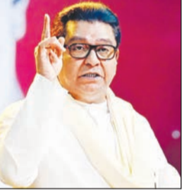
राज ठाकरे यांनी आपल्या पोस्टमध्ये सावरकरांच्या विचारांचा उल्लेख करतांना म्हटले की, सावरकर हे हिंदू राष्ट्रवाद

काही न तपासता खरे मानण्याची चढाओढ लागली आहे, असा टोला त्यांनी लगावला आहे. मांडणारे तत्त्वज्ञ, क्रियाशील धर्मसुधारक, समाजसुधारक आणि तितकेच विज्ञाननिष्ठ विचारवंत होते. माझ्या मते, सावरकर हे असे महापुरुष आहेत की, त्यांच्या टीकाकारांना पूर्ण सावरकर कधी कळले नाहीत किंवा झेपत असतील का? ज्या भूमीत सावरकर जन्माला आले त्या महाराष्ट्रात व्हॉट्सअॅप विद्यापीठात काय आले आहे ते चूक बरोबर काही न तपासता किंवा साधा विचार पण न करता खरे मानण्याची चढाओढ लागली आहे. पान ७ वर