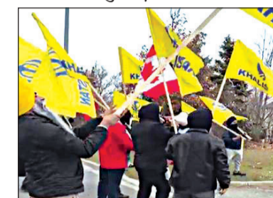
असताना घडली. खलिस्तान समर्थक आधीपासूनच त्या ठिकाणी जमले होते. ताफा पोहोचताच ते आक्रमक झाले.