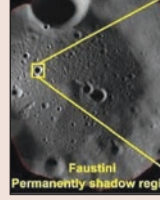
एक लहान विवर आढळून आले आहे. या लहान विवराचा व्यास सुमारे १.१ किलोमीटर आहे. या विवराच्या अंतर्भागात गोठलेल्या स्वरूपात म्हणजेच बर्फाच्या अवस्थेत पाणी असू शकते, असा निष्कर्ष चांद्रयान-२ ने दिलेल्या माहितीवरून शास्त्रज्ञांनी काढला आहे.

नवी दिल्ली चांद्रयान-२ हे चांद्राच्या दक्षिण ध्रुवावर उतरणारे जगातील पहिले अंतराळयान आहे. या यानाने चांद्राच्या दक्षिण ध्रुवावरून गोळा केलेल्या माहितीचे गुजरातच्या अहमदाबाद येथील प्रयोगशाळेमध्ये विश्लेषण केले असता चांद्रावरील काही अतिथंड अशा विवरांमध्ये गोठलेल्या अवस्थेत पाणी असल्याचे संकेत मिळाले आहेत. चांद्राच्या पृष्ठभागावर असंख्य विवरे आहेत. त्यातली फौस्तिनी नावाच्या विवरामध्ये आणखी