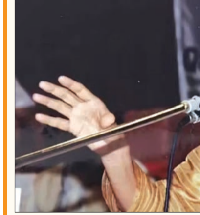
बद्र यांचे वडील पोलीसात होते. वडिलांचे निधन झाले तेव्हा बशीर बद्र नुकतेच हायस्कूल पास झाले होते. कुटुंबाची जबाबदारी त्यांच्या खांद्यावर पडली, त्यानंतर त्यांनी शिक्षण सोडून पोलीस

डॉ. बशीर बद्र यांनी वयाच्या सातव्या वर्षापासून गझल लिहिण्यास सुरुवात केली. बशीर बद्र सातव्या वर्गात असताना त्यांची एक गझल 'निगा' नावाच्या मासिकात प्रकाशित झाली होती. वयाच्या २० व्या वर्षी त्यांच्या गझलस सीमा ओलांडून पाकिस्तानातही प्रसिद्ध झाल्या होत्या. त्यानंतर बशीर बद्र यांची अगोखी गझलस ऐकण्यासाठी लोक मुशायर्यांना गर्दी करू लागले. परंतु १९८० सालानंतर त्यांच्या रचना खूप लोकप्रिय झाल्या. बशीर बद्र हे अनेक वर्षांपासून पोलीस खात्यात काम करत होते. त्यांचे पोलीस खात्यात येणे हा योगयोगच होता. बशीर