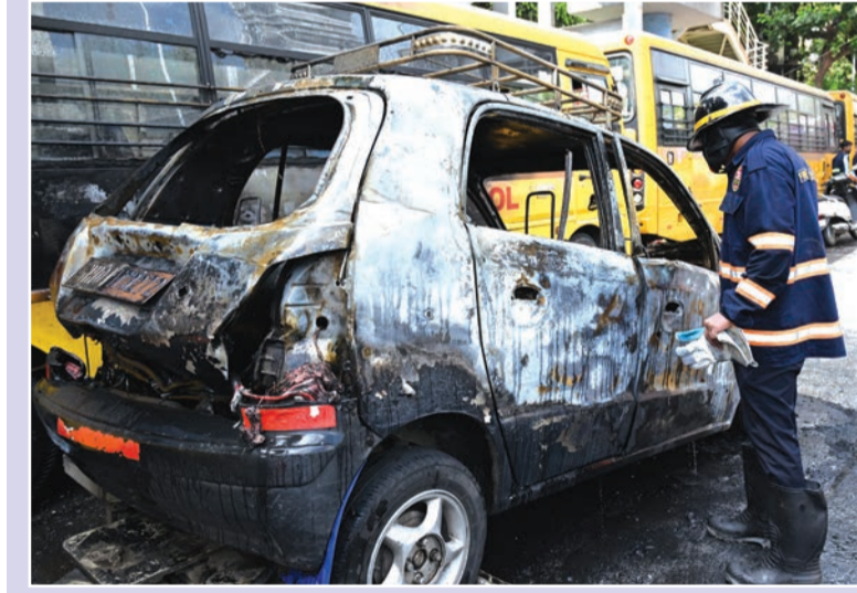
सायन हॉस्पिटलजवळ सकाळी टॅक्सीला अचानक आग लागली. त्यात टॅक्सी जळून रवाक झाली.

खाते बंद करणे योग्य नाही. यावर न्यायालयाने, या प्रकरणात संपूर्ण कृतीच काही प्रमाणात आक्षेपाई वाटते, असे निरीक्षण नोंदवले. तथापि, न्यायालयाने दीपके यांना केंद्र सरकारच्या पुनरावलोकन समितीसमोर आपली बाजू मांडण्याची संधी दिली आहे. ही समिती सोशल मीडिया खाती ब्लॉक करण्याच्या आदेशांचा आढावा घेते. कॉकरोच जनता पार्टीची सुरुवात उपरोधिक स्वरूपातील संघटना म्हणून झाली होती. काही वादग्रस्त वक्तव्यांनंतर युवकांमध्ये आणि विरोधी पक्षांमध्ये या पक्षाची लोकप्रियता वाढली.